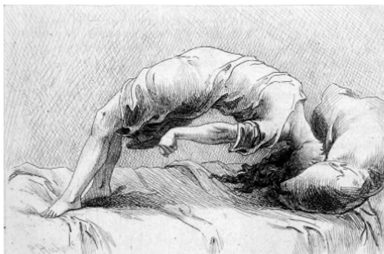
Figura 5: Mulher com sintomas de conversão histérica

Freud recebeu, em 1885, uma bolsa para ir à Paris, assistir ao curso de Jean-Martin Charcot, especialista em histeria no Hospital La Salpêtrière. A histeria, caracterizada por sintomas que fazem do corpo o seu palco, tais como paralisias, convulsões, contraturas, tiques, dentre outros; e por sintomas psíquicos como alucinações, angústias, obsessões sexuais, além de relatos de traumas e abusos vividos na infância, foi considerada por séculos um mal originado no útero (Didi-Huberman, 2015), portanto, uma espécie de loucura da qual as mulheres não só padeciam, mas pelo qual eram possuídas.