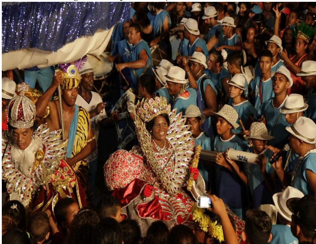
Figura 3: Cortejo real da Nação Estrela Brilhante do Recife