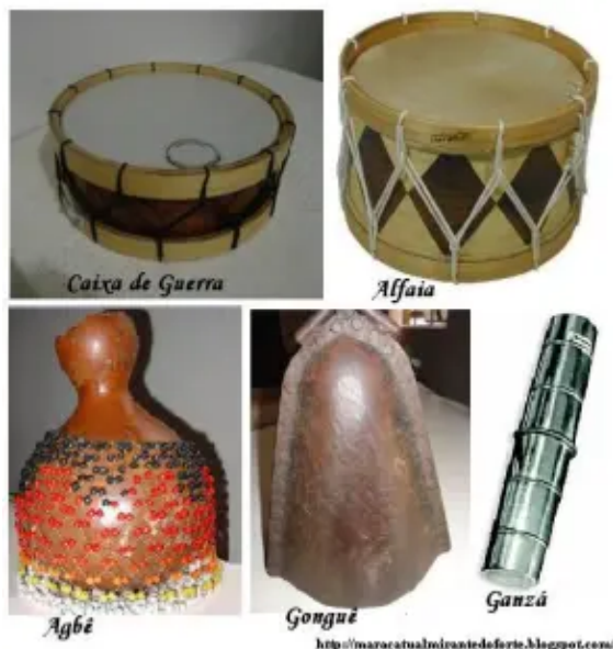
Figura 4: Alguns dos instrumentos utilizados no Maracatu Nação

G. Loas e toadas: trata-se, conforme Alencar (2015), das canções entoadas pelos batuqueiros, nas quais o mestre faz a chamada (primeira voz) e os batuqueiros respondem (segunda voz), em coro.