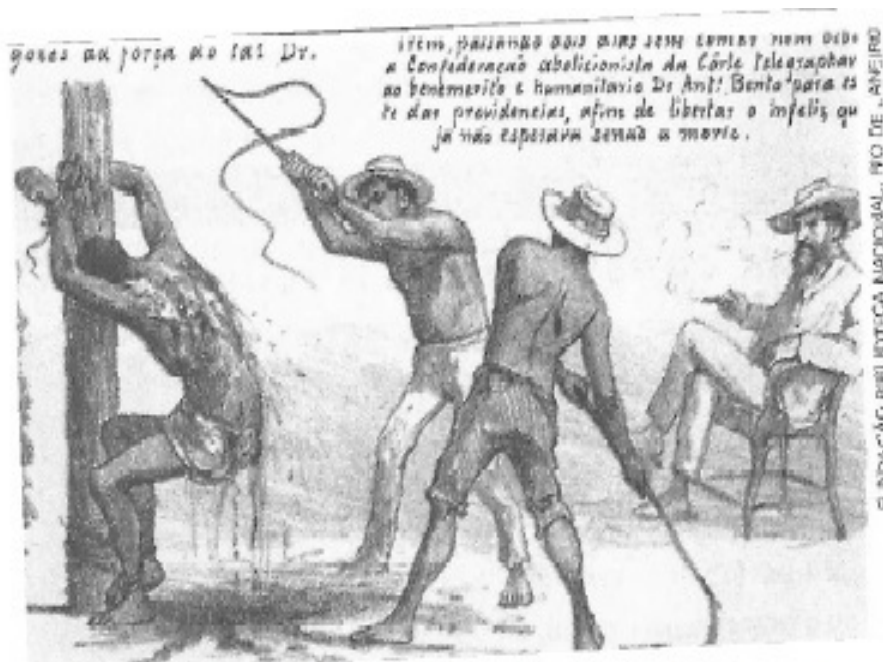
Figura 7: Homem escravizado sendo chicoteado

Preso ao tronco escravo é impiedosamente chicoteado sob o olhar do fazendeiro. Desenho de Angelo Agostini, publicado na Revista Ilustrado.