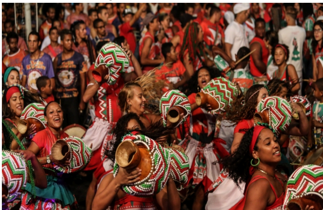
Figura 1: Nação do Maracatu Porto Rico

Fonte: Foto Allan Torres/ArquivoPCR, Secretaria de Cultura, Recife- PE link