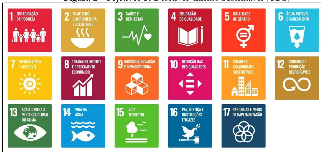
Figura 1 - Objetivos de Desenvolvimento Sustentável (ODS)