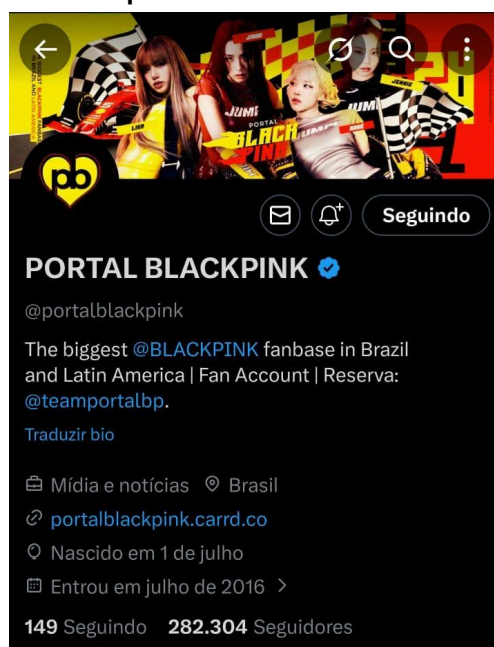
Figura 6 - Portal Blackpink no X.