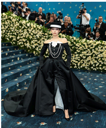
Figura 5 – Jennie Kim no Met Gala.