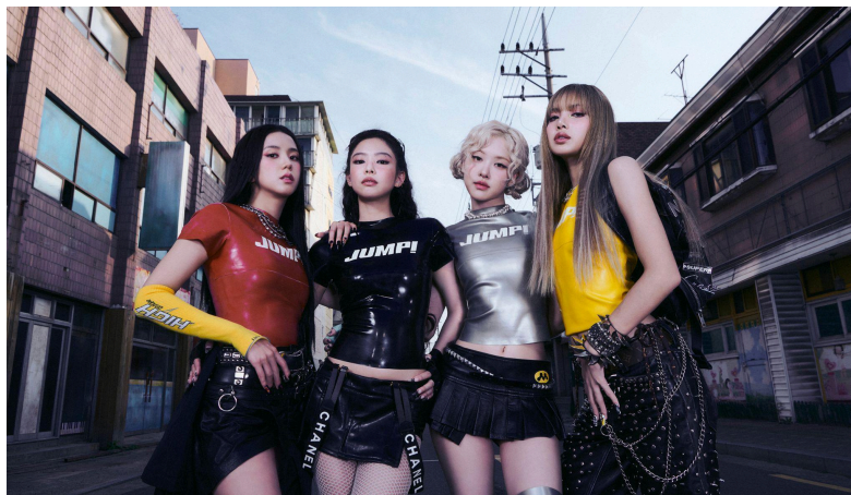
Figura 2 – Imagem promocional do grupo Blackpink.