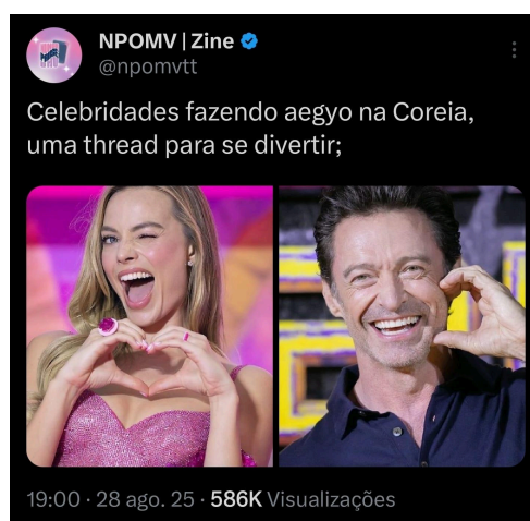
Figura 1 – Uso do termo maknae em interação de fãs na rede social X.