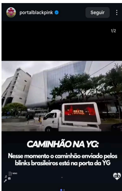
Figura 7 - Caminhão de apoio enviado pelo Portal Blackpink à YG Entertainment.