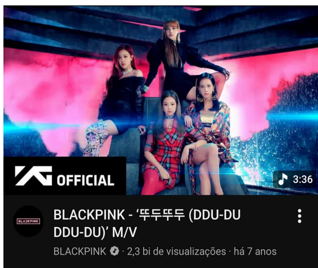
Figura 3 – Desempenho do videoclipe da música Ddu-Du Ddu-Du na plataforma YouTube.