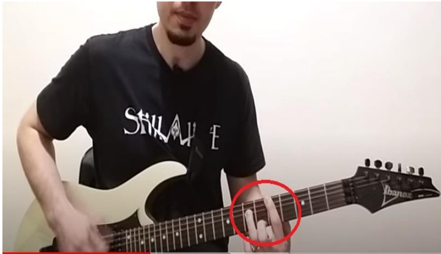
Imagem 6 - Power Chord invertido