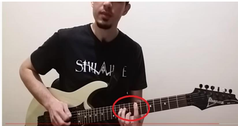
Imagem 9 - Power Chord com intervalo de sexta menor