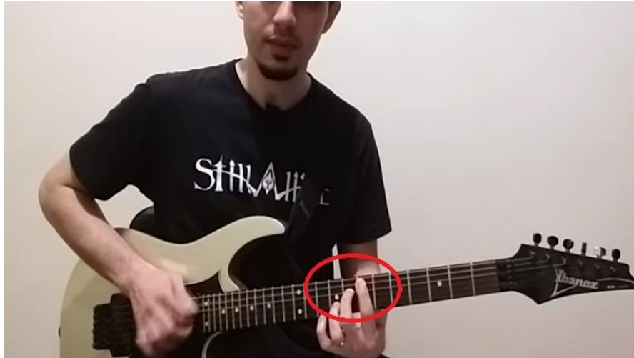
Imagem 8 - Power Chord com quinta diminuta