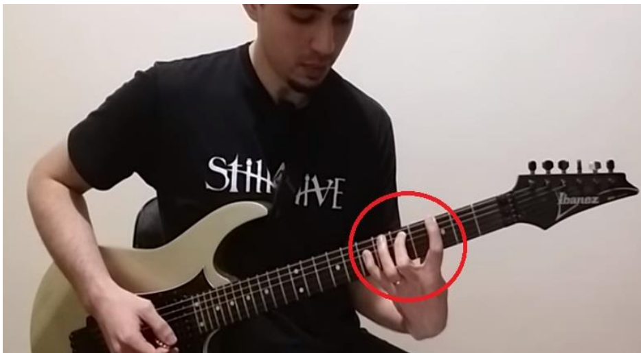
Imagem 7 - Power Chord com intervalo de nona