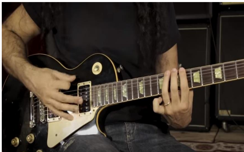
Imagem 3 - Aspecto visual da videoaula de Rodrigo Flausino