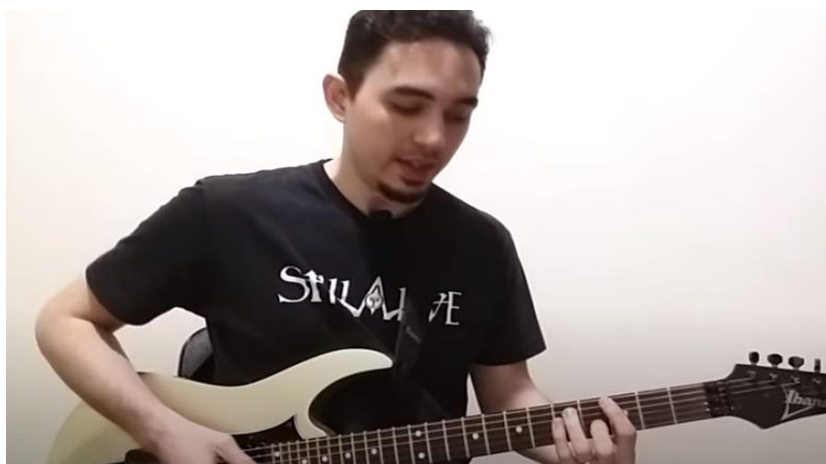
Imagem 4 - Aspecto visual da videoaula de Gil Vasconcelos