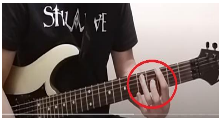
Imagem 5 - Power Chord com tônica e quinta justa