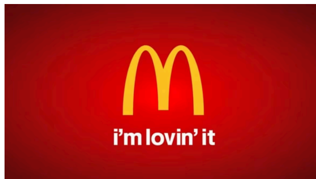
Figura 5 - I’m lovin’ it.

Outro caso relevante é a campanha “I’m Lovin’ It”, da McDonald’s, lançada em 2003 como uma estratégia global da marca para se conectar emocionalmente com o público, o projeto ganhou destaque por utilizar um tom afetivo e próximo ao cliente, com foco na experiência do consumidor, sendo veiculada em comerciais de TV, rádio, pontos de venda, embalagens e mídias digitais, além de ter colaboração com um artista que no ano estava em destaque, o Justin Timberlake.