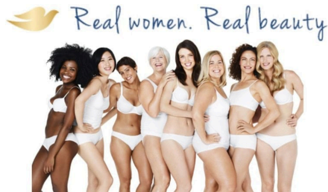
Figura 4 - Dove Real Woman. Real Beauty.