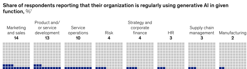
Figura 2 - Adoção de IA generativa pelas organizações

Do ponto de vista global, a pesquisa “O estado da IA em 2023: o ano de destaque da IA generativa” da McKinsey (2023) destaca a importância crescente da inteligência artificial no ambiente corporativo. Segundo o estudo realizado com líderes de empresas em 2023, “três quartos de todos os entrevistados esperam que a IA de geração cause mudanças significativas ou disruptivas na natureza da concorrência em seus setores nos próximos três anos”. Além disso, a pesquisa “ From Click to Conversion. Redefining Personalization with AI ” realizada pela NIQ (2024), é apontado que a IA já está transformando o mercado de varejo ao permitir a criação de experiências altamente personalizadas, entregando “o conteúdo certo, no momento certo e pelo canal certo”, fator que aumenta tanto a conexão com o público quanto a receita das marcas. Com isso, como mostra a tabela, os usos mais comuns das ferramentas de IA generativa estão concentrados em marketing e vendas, desenvolvimento de produtos e serviços e operações de serviço, mostrando como a tecnologia já está sendo inserida em diferentes áreas.