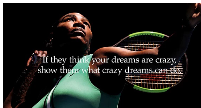
Figura 6 - Show them what crazy dreams can do.

Nesse sentido, nos últimos anos, diversas campanhas publicitárias se destacam por usar esses métodos estratégicos, mostrando que as macrotendências podem gerar grande impacto cultural e comercial. Um ótimo exemplo é a campanha "Dream Crazier" da Nike, lançada em 2019, baseada na ascensão das pautas femininas e na valorização das mulheres no esporte e suas emoções. Narrada pela tenista Serena Williams, a campanha teve ampla repercussão nas redes sociais, televisão e plataformas digitais, destacando a superação de preconceitos de gênero e a quebra de estereótipos. Com isso, a marca antecipou e reforçou debates sobre igualdade e empoderamento, e conseguiu mostrar seus valores aumentando ainda mais suas conexões com os consumidores.