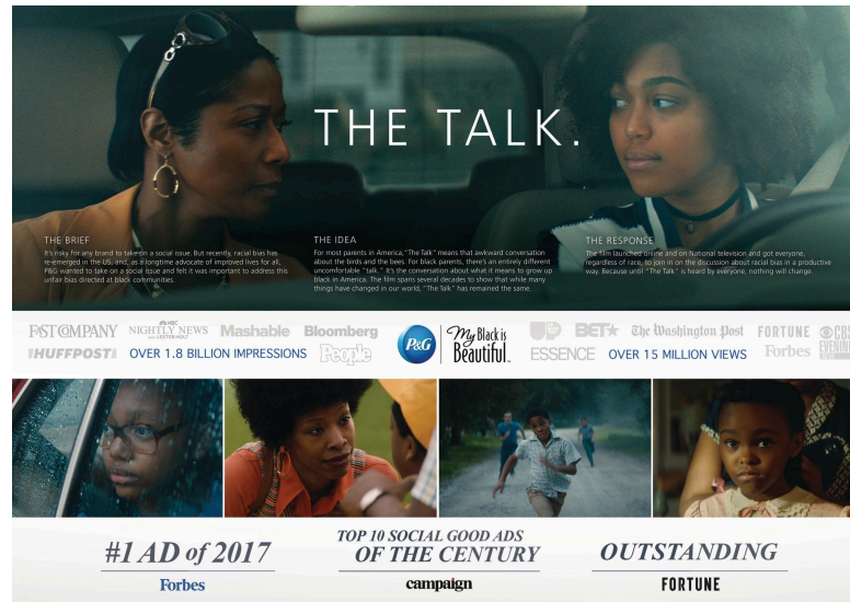
Figura 7 - The Talk

repercussão, pois não só refletiu uma tendência global de discussão sobre igualdade racial, como também consolidou a conexão emocional entre marca e público ao tocar um tema sensível e urgente.