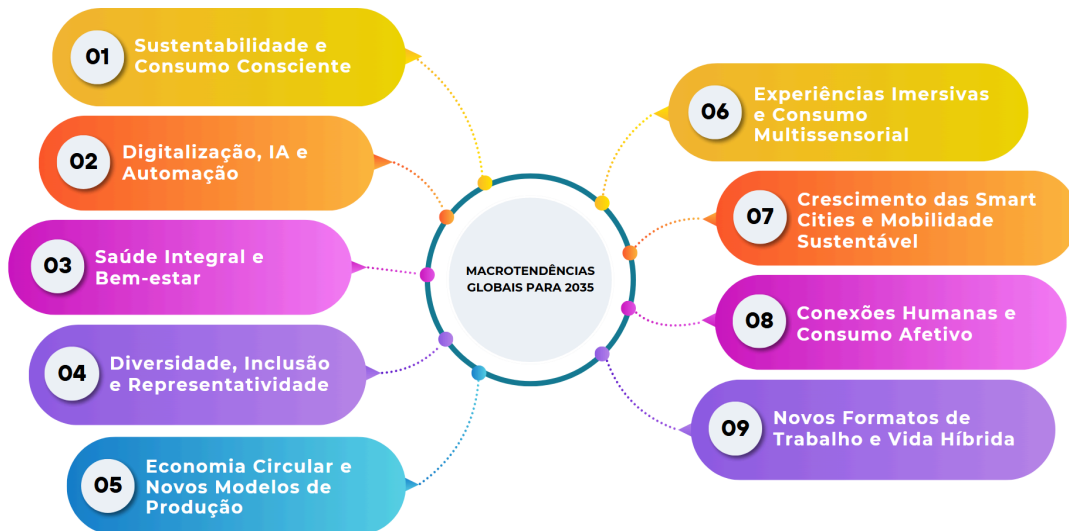
Figura 3 - Mapa Mental das Macrotendências Globais para 2035

Diante desse cenário, as macrotendências analisadas têm grande potencial de alterar e criar novos caminhos para a publicidade na próxima década, além de afetar outras vertentes, como, hábitos de consumo e nas relações sociais, exigindo das marcas uma comunicação mais estratégica e autêntica. Como destacam fontes como WGSN, McKinsey, NIQ, TrendWatching e FIESP, o desafio será ir além da venda de produtos, criando campanhas alinhadas a valores sociais, sustentabilidade, tecnologia e novas formas de viver e consumir. A adaptação a essas transformações será fundamental para manter relevância e engajamento no mercado publicitário.