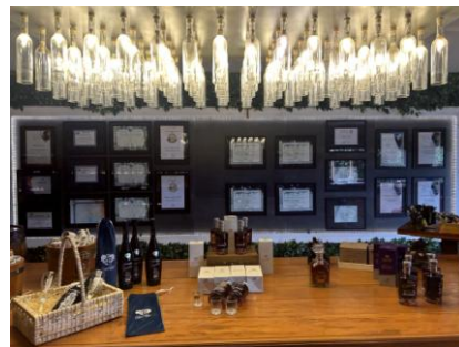
Figura 12: Prêmios e Certificados