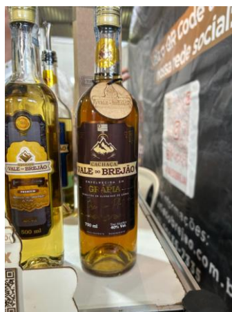
Figura 18: Cachaça Vale do Brejão (Amazonas)