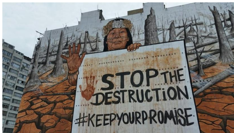
Figura 23: Mural gigante pede o fim dos crimes ambientais no Brasil 27