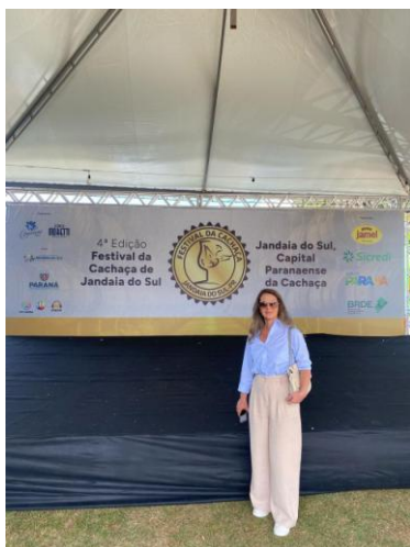
Figura 15: 4ª Edição do Festival da Cachaça