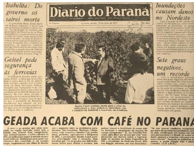
Figura 1: Reportagem sobre a geadada negra

Sou filha de migrantes nordestinos, com um orgulho profundo das raízes que me sustentam. Meus pais partiram de Recife - PE rumo ao Norte Novo do Paraná, movidos pela esperança em um Eldorado que prometia terra fértil e oportunidades. Encontraram em Jandaia do Sul o chão onde plantaram suas vidas. Nasci em 1975, ano em que a geadada negra devastou plantações de café e redesenhou o destino de milhares de famílias. Foi nesse cenário de ruína e reinvenção que minha história começou.