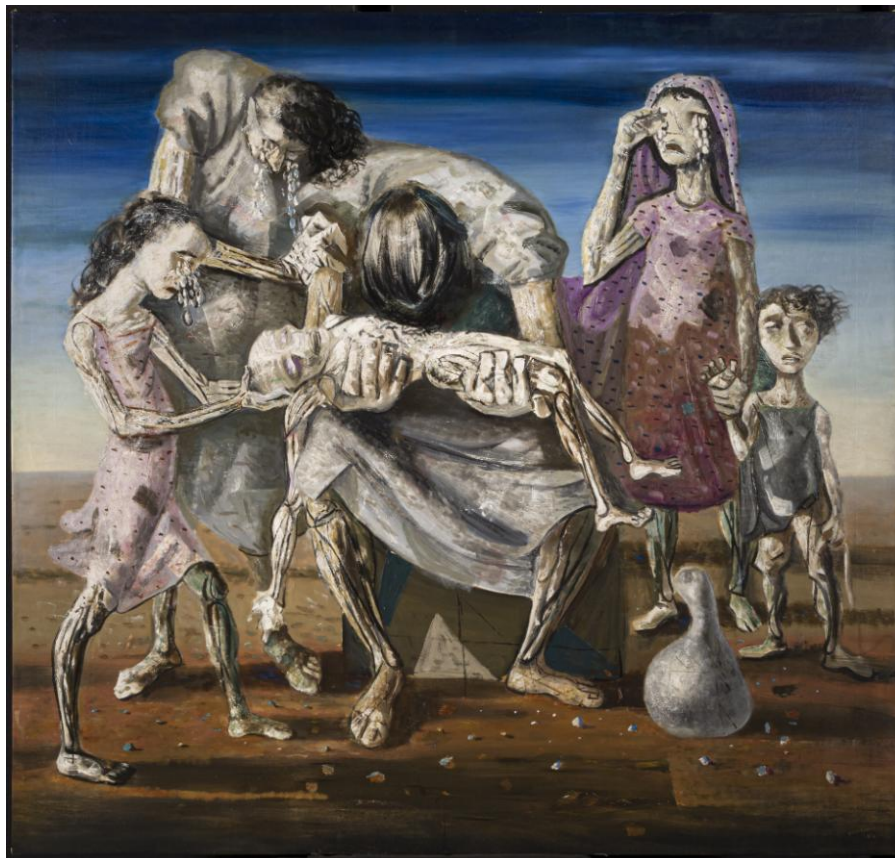
Figura 8: Criança Morta de Candido Portinari