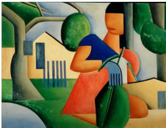
Figura 2: A Caipirinha de Tarsila do Amaral 7