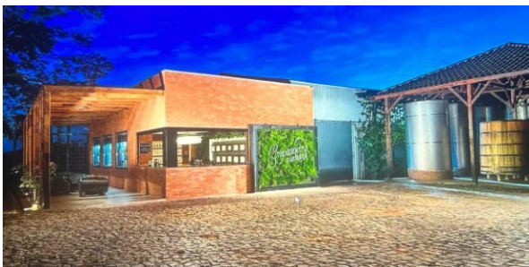
Figura 11: Alambique A Companheira

Fonte: https://cachacacompanheira.com.br/loja_e_alambique/