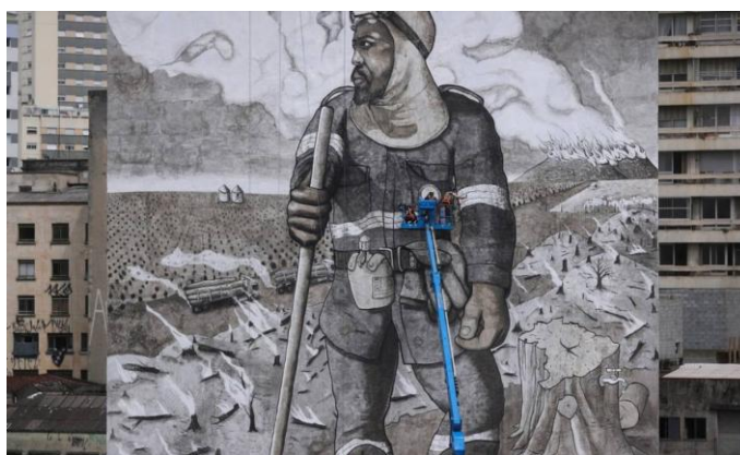
Figura 22: O Brigadista de Mundano