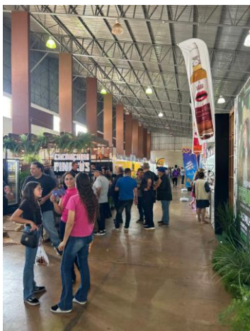
Figura 17: Pavilhão de exposição (2)