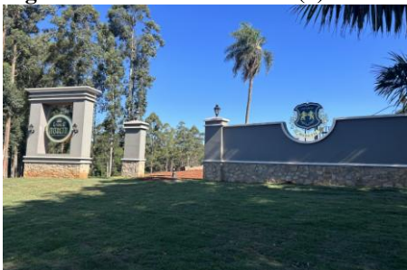
Figura 13: Estância Moretti (1)