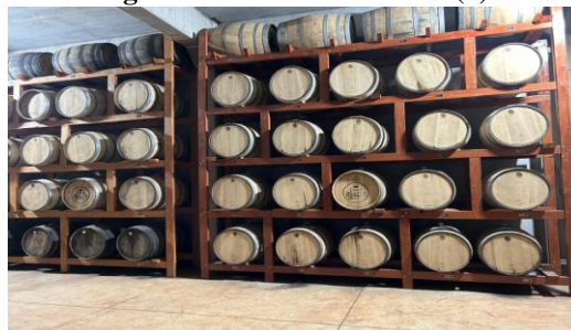
Figura 14: Estância Moretti (2)