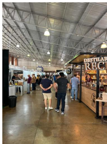
Figura 16: Pavilhão de exposição (1)