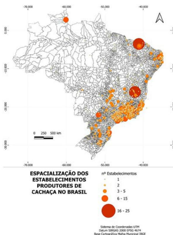
Figura 4: Distribuição espacial da produção de cachaça no território brasileiro