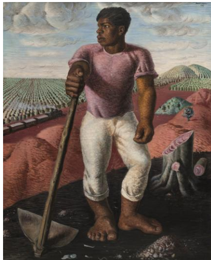
Figura 21: O Lavrador de Candido Portinari 26