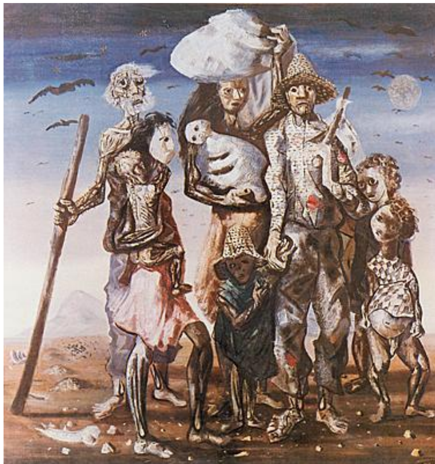
Figura 7: Os Retirantes de Candido Portinari 24