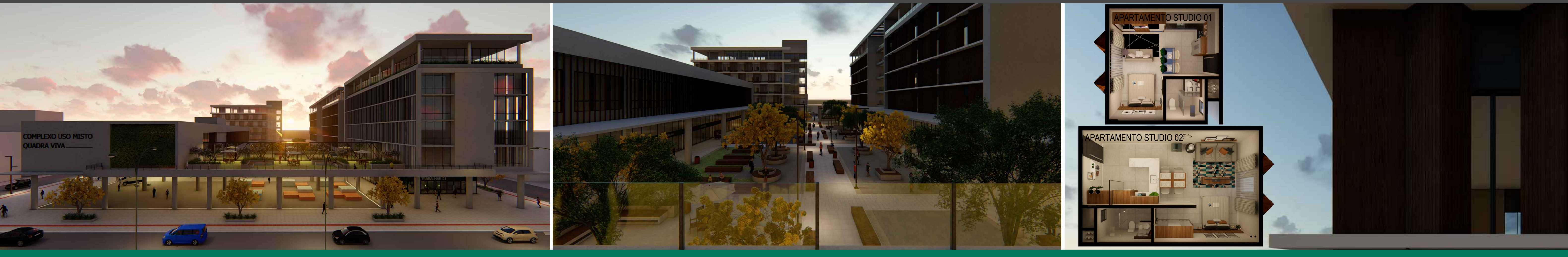
PLANTAS BAIXAS - APARTAMENTOS