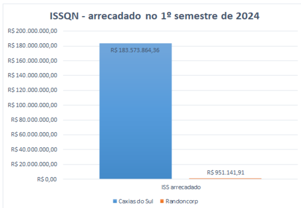
Figura 3- ISSQN arrecadado no primeiro semestre de 2024

De todos os anos aqui analisados, o ano de 2023 é o período em que o município mais reteve valores em arrecadação e foi o ano em que as empresas menos “contribuíram” para o mesmo. Em 2023 as empresas arrecadaram 100 mil a menos que no ano passado, um valor consideravelmente alto, mas levando em consideração que o ISSQN arrecadado teve um aumento de quase 40 milhões, a quantia do grupo se faz quase que imperceptível em porcentagens, totalizando cerca de 0,61%. Como se fez anteriormente, se descontássemos o valor das empresas na contribuição, o município teria retido um total de R$ 288.981.342,39, o que quando colocado este valor ao lado do correto podemos ver a importância.