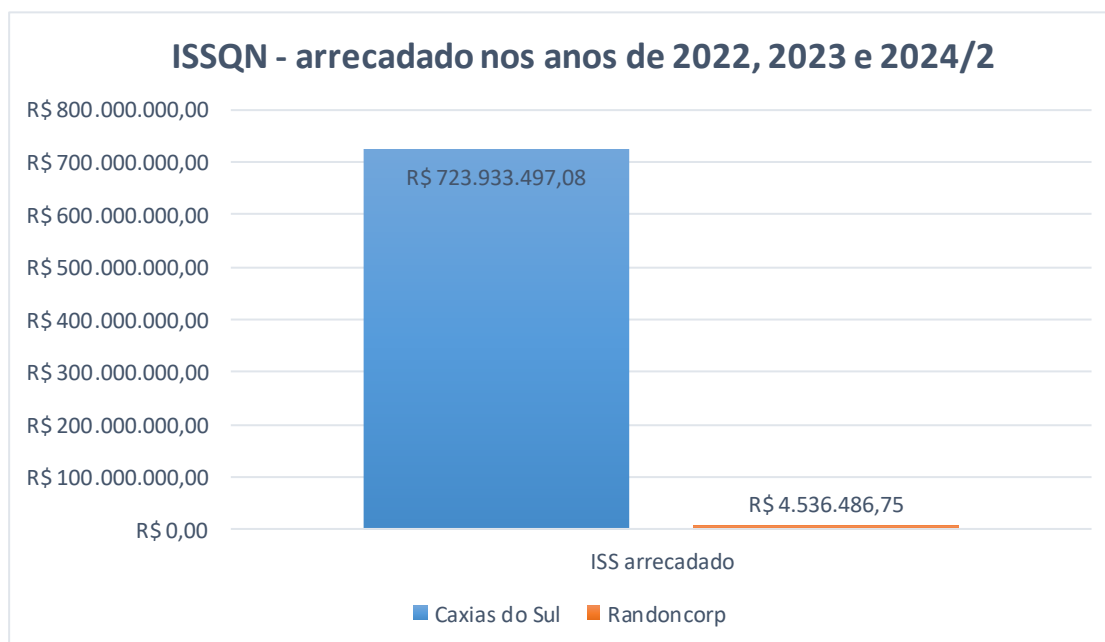
Figura 4- ISSQN arrecadado nos anos de 2022, 2023 e 2024/2

Na figura 4 é apresentado os valores de ISSQN nos três anos com a contribuição do Grupo e do município de Caxias do Sul.