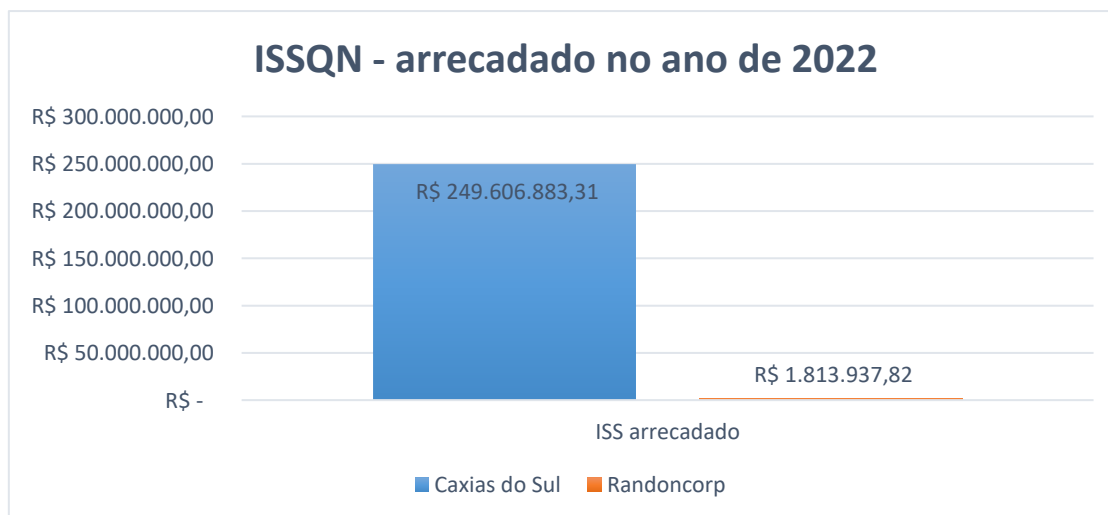
Figura 1- ISSQN arrecadado no ano de 2022

Na figura 1, podemos verificar o valor do ISSQN que foi arrecadado no ano de 2022 pelo Randoncorp e pelo município de Caxias do Sul.