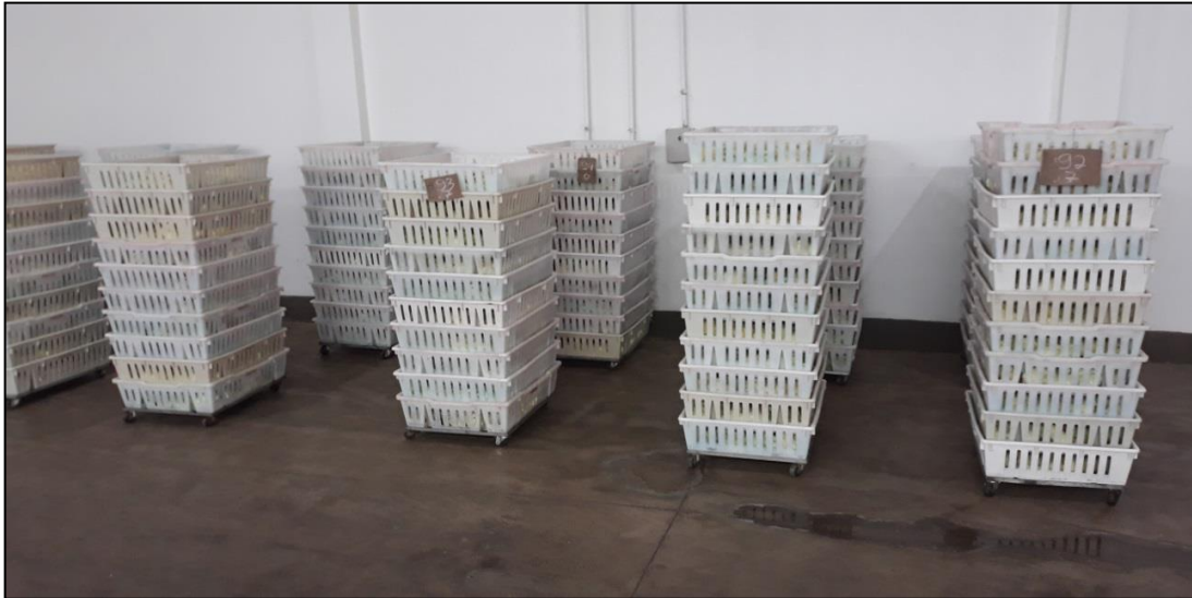
Figura 28 - Caixas aguardando a expedição

Depois de serem vacinados, os pintos podiam ser expedidos. As caixas aguardavam (Figura 28) pelo carregamento rumo às granjas de produção de frangos de corte.