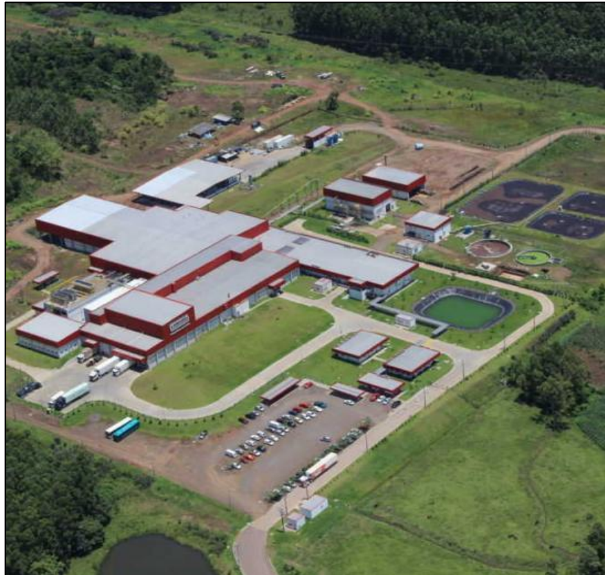
Figura 2 - Frigorífico de Suínos na cidade de Poço das Antas (RS)