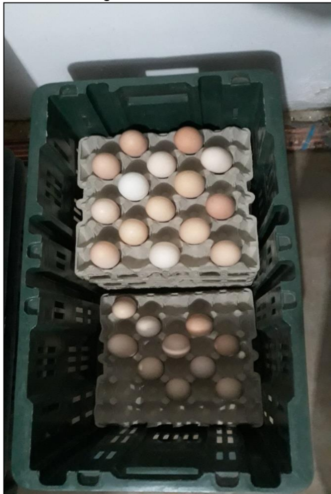
Figura 19 - Ovos extra

Os ovos extra ou comerciais são aqueles com alteração de formato, deformidades na casca, os redondos e os demasiadamente grandes e/ou alongados. Eles eram acondicionados nas bandejas, deixando sempre um espaço entre um ovo e outro, pois como eram mais pesados, as bandejas não suportariam caso fossem totalmente preenchidas. Assim sendo, cada bandeja comportava apenas 15 ovos, metade da sua capacidade (Figura 19) e, já que não eram ovos incubáveis, estavam destinados à comercialização para terceiros.