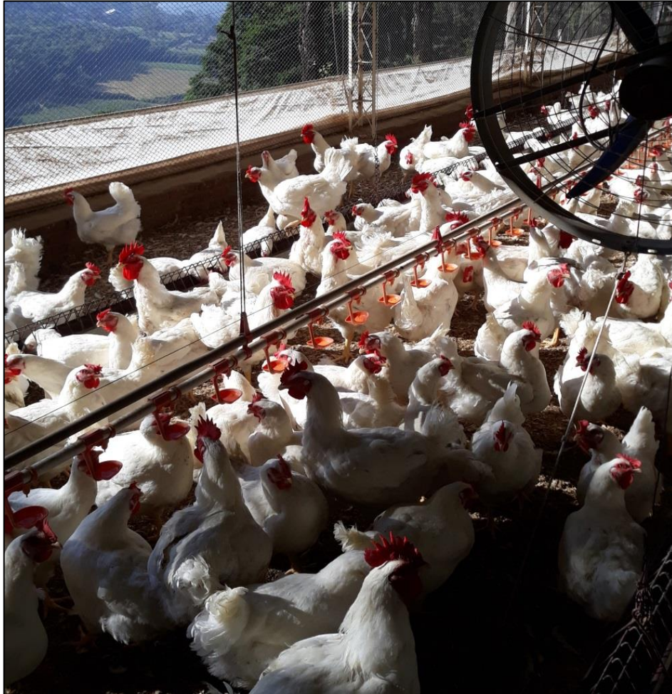
Figura 13 - Linha de bebedouro entre as calhas de arraaçoamento em galpão com ninho manual