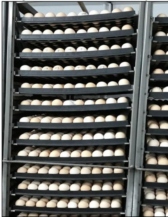
Figura 22 - Carrinho de incubação