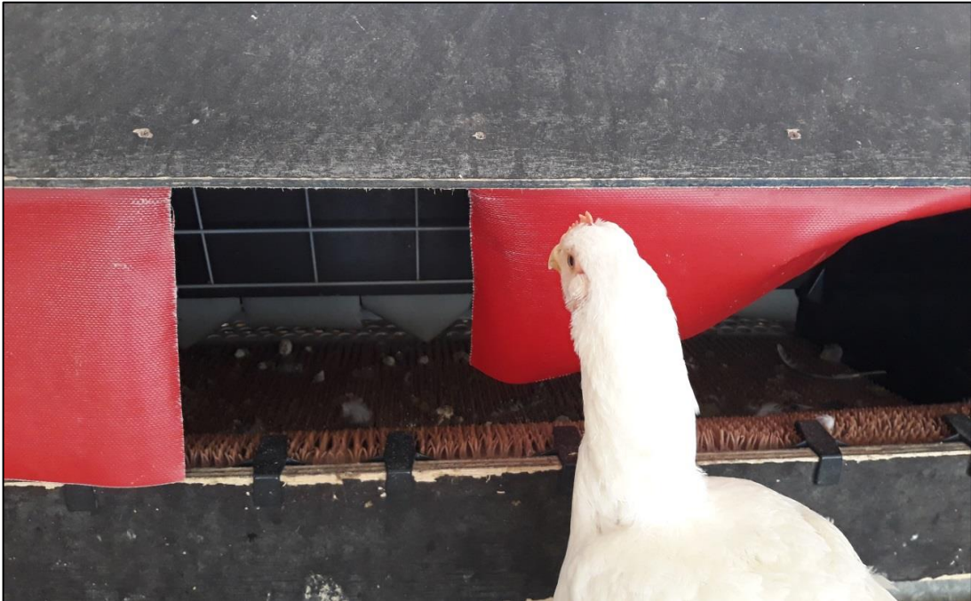
Figura 14 - Abertura do ninho automático