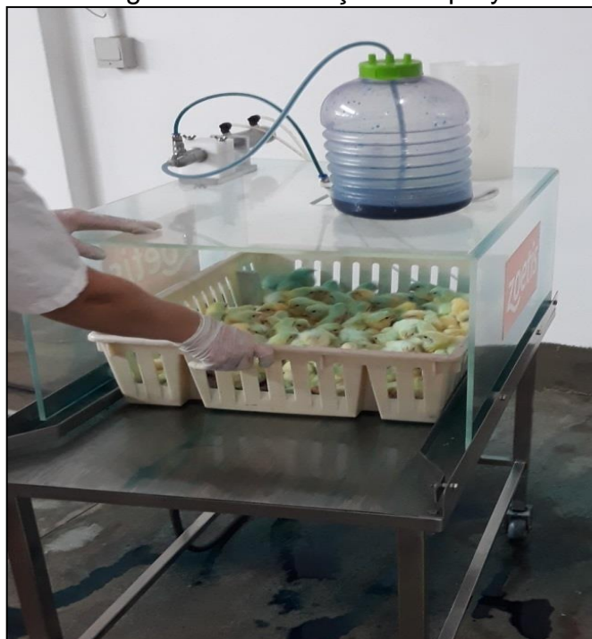
Figura 27 - Vacinação via spray