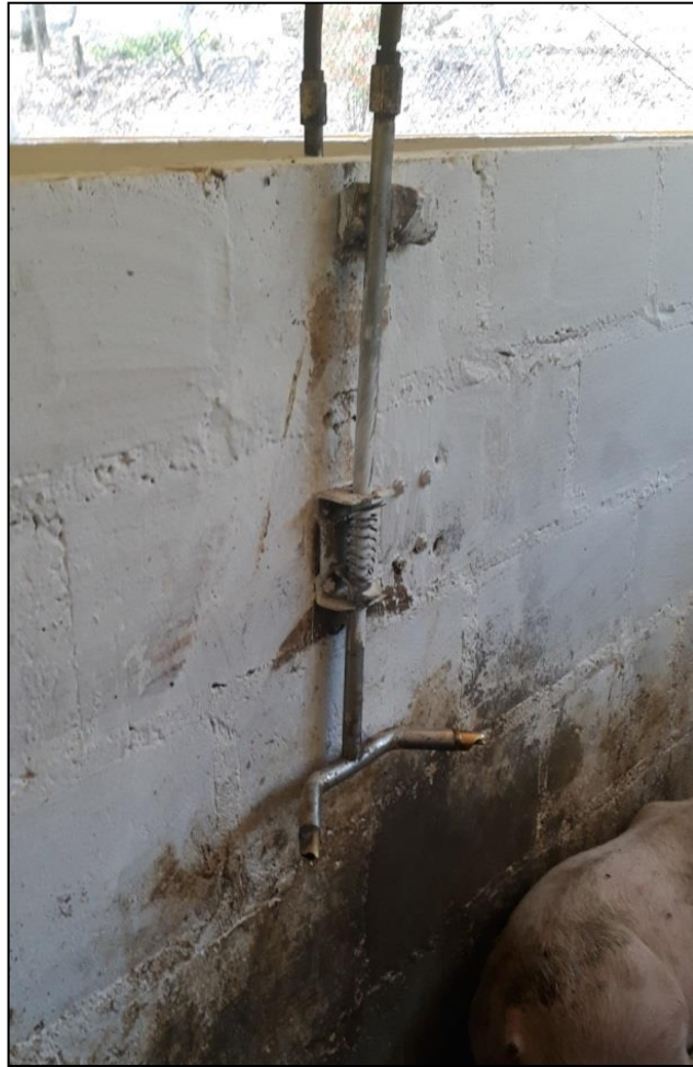
Figura 32 - Bebedouro tipo chupeta