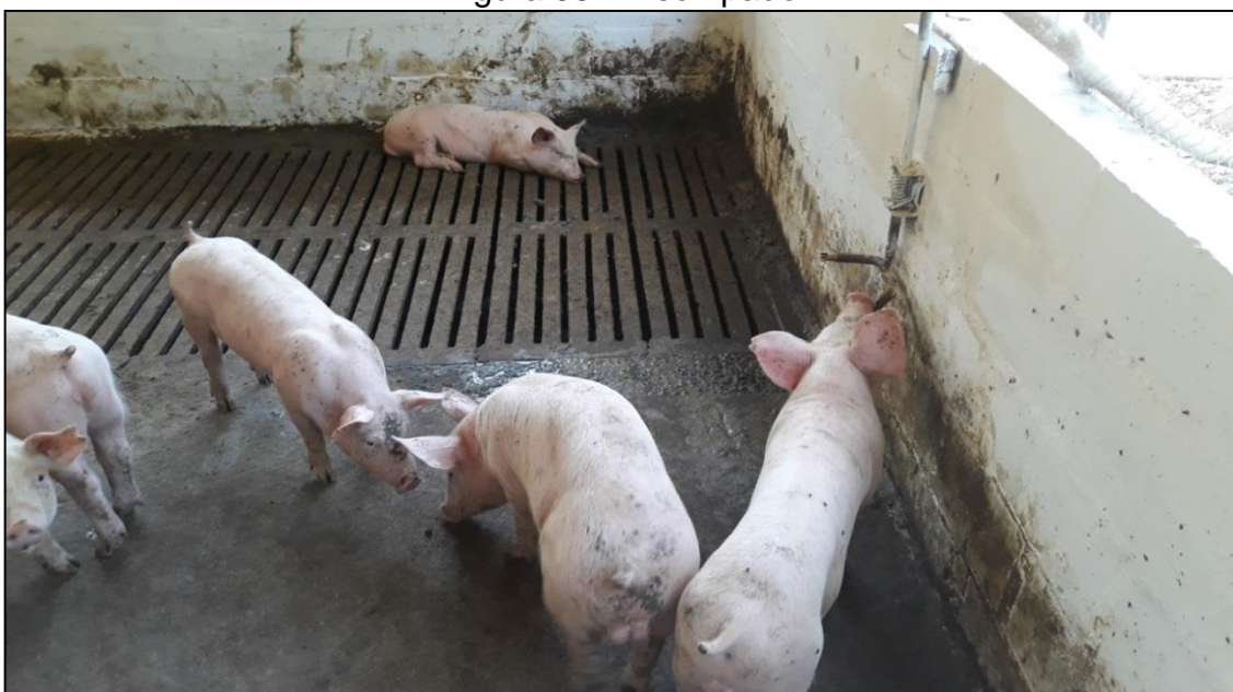
Figura 35 - Piso ripado

O piso ideal para as baias deveria ser metade do seu piso em concreto e o restante vazado, para um escoamento contínuo dos dejetos (OLIVEIRA, SILVA, 2006). Assim, a baia permanece mais tempo seca e sem acúmulo de esterco (Figura 35), garantindo maior nível de sanidade e conforto aos animais, favorecendo uma boa evolução do lote (MORÉS, GAVA, 2017).