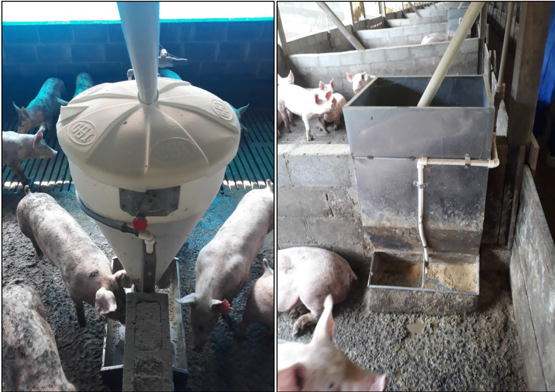
Figura 31 - Comedouros automáticos