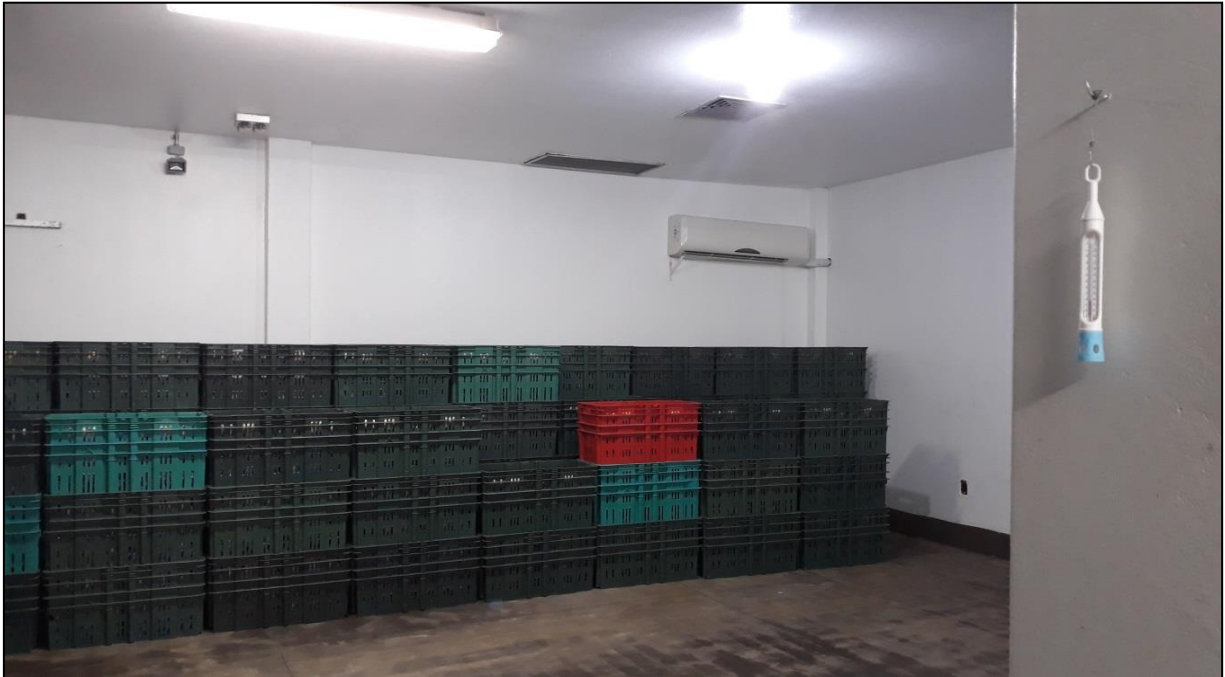
Figura 20 - Sala de classificação e armazenagem de ovos