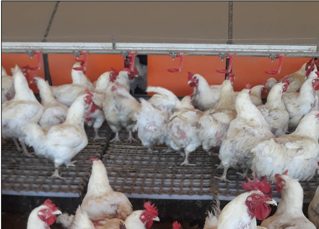
Figura 12 - Bebedouros Nipple