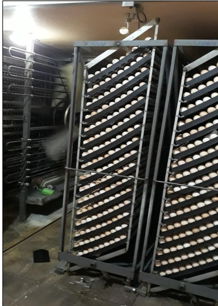
Figura 24 - Ovos incubados em viragem

Os carrinhos possuem mecanismos que permitem a viragem dos ovos a 45 graus automaticamente (Figura 24), que ocorria a cada 1 hora, a partir do 2º dia de incubação, até o 16º dia. A viragem dos ovos evita a aderência do embrião à casca e, conseqüentemente, a sua morte (SANTANA et al., 2013). A incubação fornecia a temperatura, umidade e ventilação ideais para o desenvolvimento do embrião.