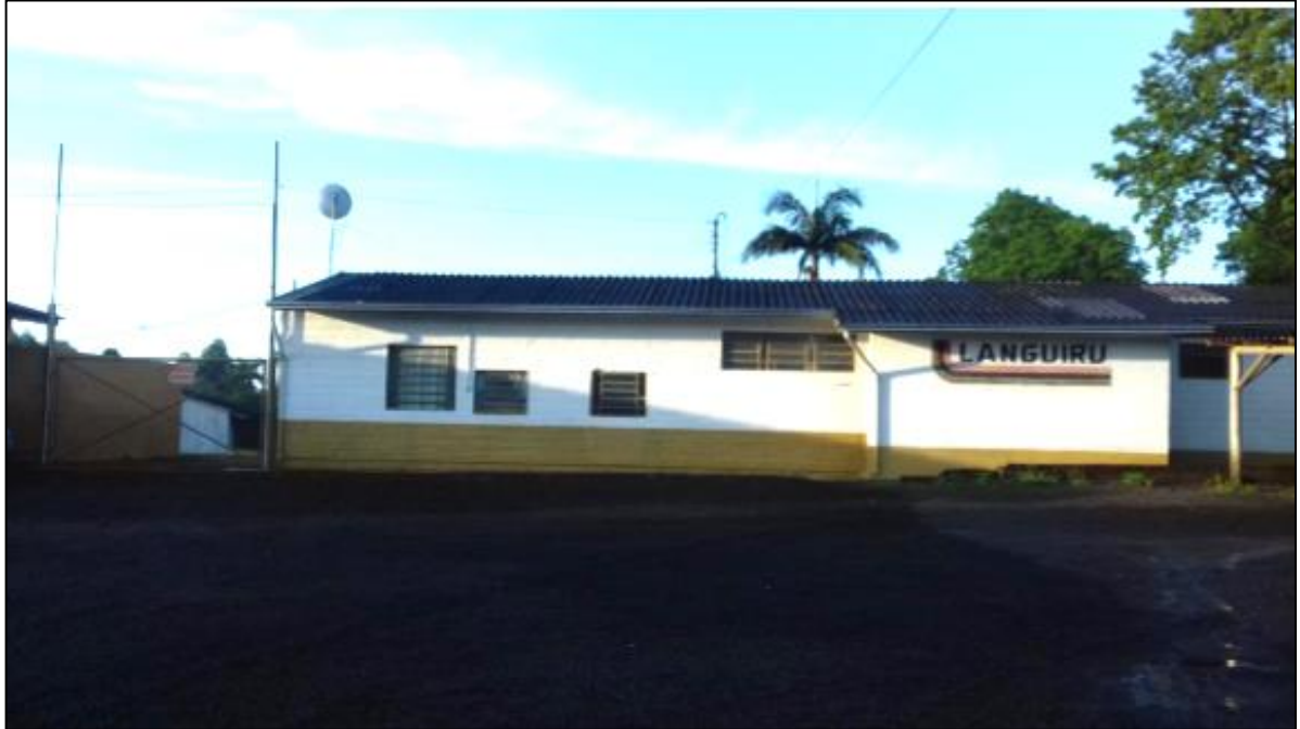
Figura 3 - Fachada do Matrizeiro na Linha Harmonia

galpões por núcleo), situados nas cidades de: Arroio do Meio, Capitão, Colinas, Cruzeiro do Sul, Paverama, Teutônia, Venâncio Aires e Westfália.