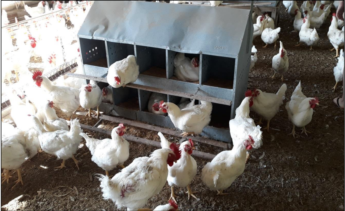
Figura 17 - Ninhos manuais

tenham ninhos suficientes disponíveis para o número total de matrizes do lote, uma vez que a baixa oferta de ninhos pode acarretar no aumento da postura de ovos de cama (PILOTTO et al., 2010).