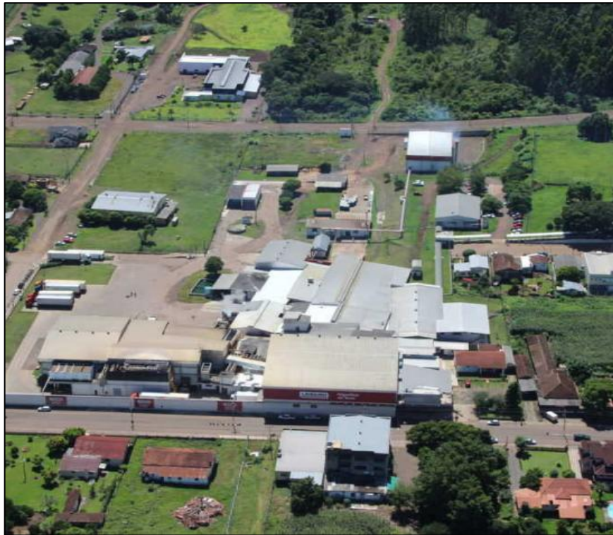
Figura 1 - Frigorífico de aves na cidade de Westfália (RS)