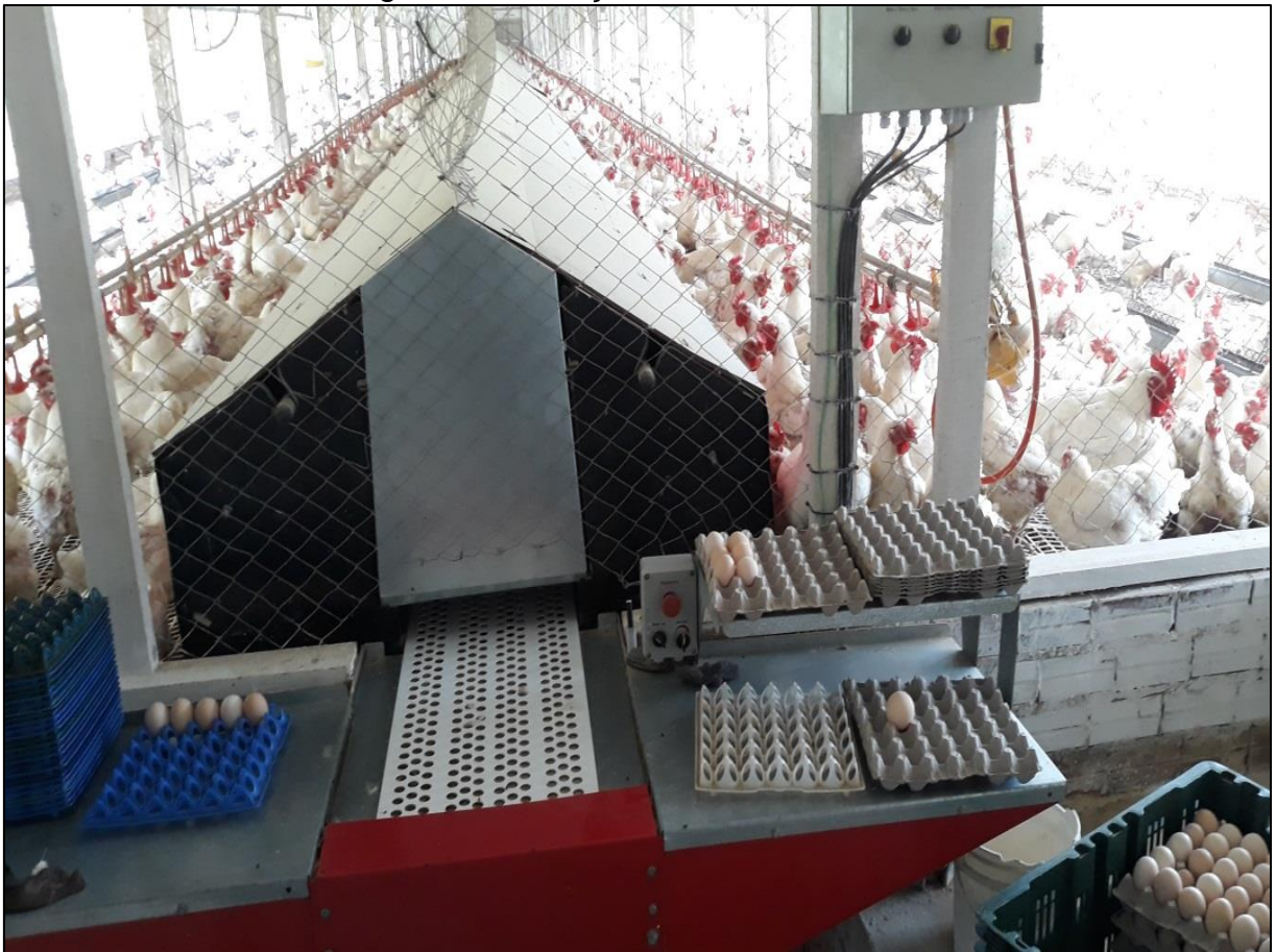
Figura 16 - Estação de coleta de ovos

Havia um sistema de expulsão que era acionado juntamente com a esteira, fazendo com que as aves que estavam dentro dos ninhos saíssem dali, a fim de recolher todos os ovos postos até o momento. Os ovos rolavam do ninho para a esteira através da calha, de ambos os lados, escoando a produção até a extremidade do galpão, onde um funcionário aguardava na estação de coleta (Figura 16) para alocar os ovos nas bandejas. A esteira era acionada cerca de cinco vezes ao dia, sendo 3 na parte da manhã e 2 vezes à tarde.