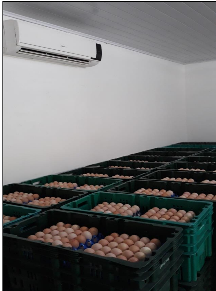
Figura 18 - Sala de ovos

Após a fumigação com paraformol, as caixas contendo as bandejas de ovos eram levadas para a sala de espera ou sala de ovos (Figura 18), onde ficavam armazenados até o carregamento para o incubatório. A temperatura desta sala era mantida entre 18 e 20°C, mantendo a viabilidade da fertilidade e eclosão dos ovos. Esta temperatura serve para pausar o desenvolvimento embrionário, uma vez que este processo necessita de uma temperatura de cerca de 35°C (JESUS, 2011).