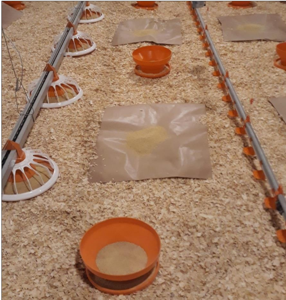
Figura 8 - Comedouros infantis, automáticos e bebedouro tipo Nipple usados na fase de recria

c) Comedouros automáticos tipo prato: são os comedouros fixos do aviário, utilizados até o final do lote, onde é possível ajustar a quantidade de ração e altura conforme o desenvolvimento das aves.