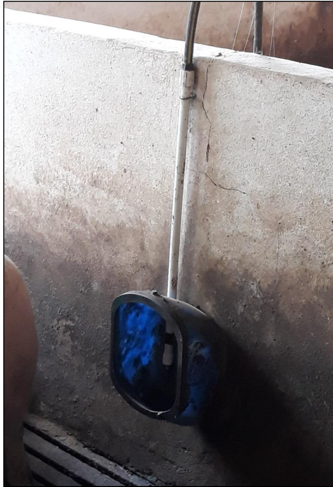
Figura 33 - Bebedouro ecológico