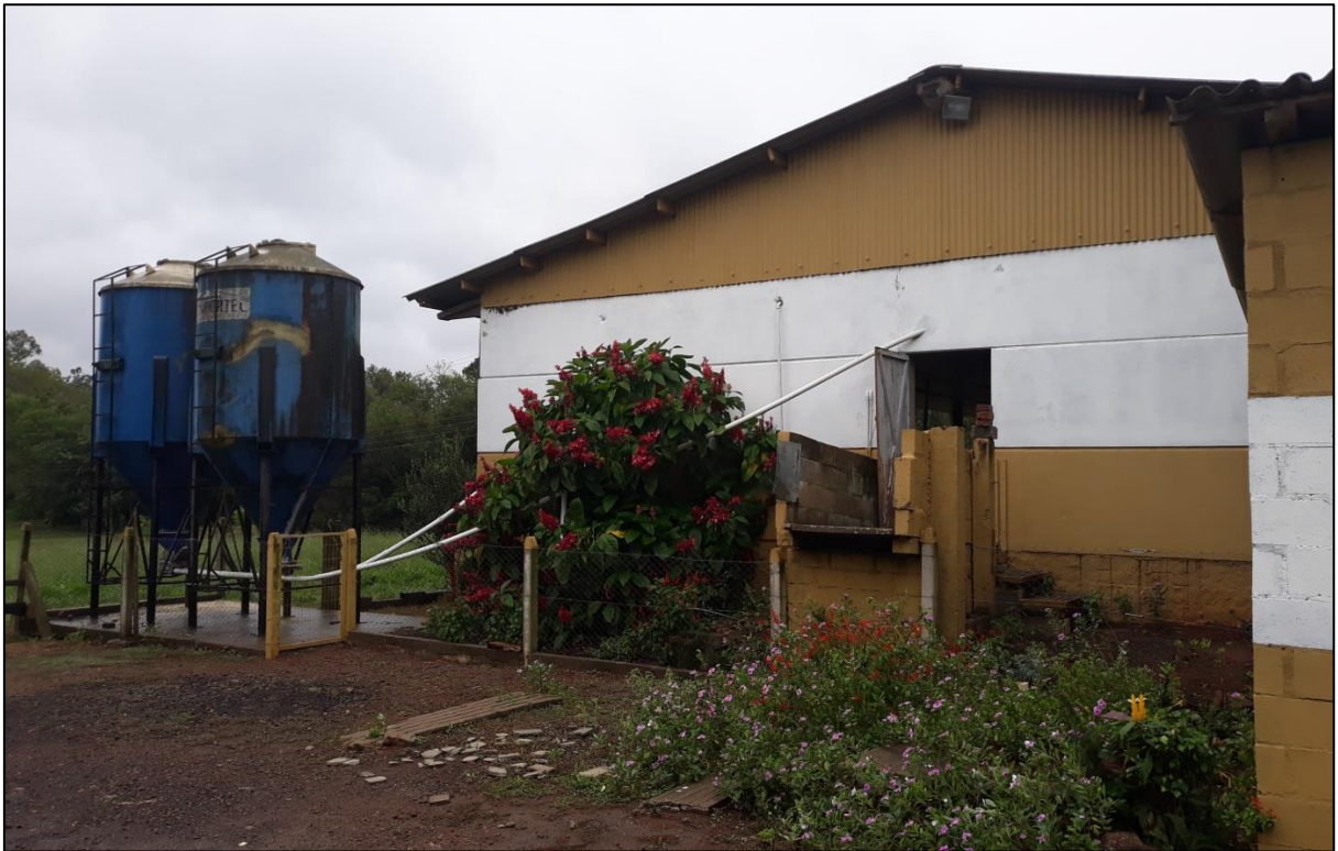
Figura 29 - Vista frontal de galpão de terminação de suínos