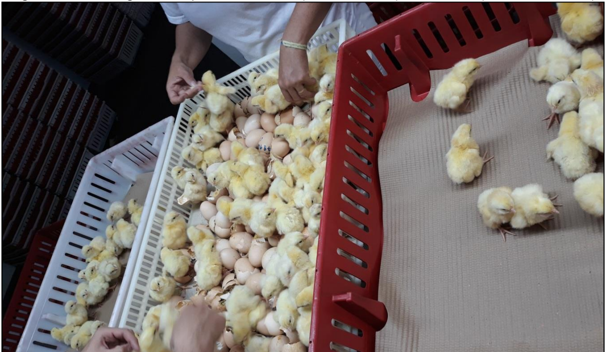
Figura 25 - Sexagem dos pintos: fêmeas (caixa branca) e machos (caixa vermelha)

Após o nascimento era feita a sexagem dos pintos manualmente através da diferenciação das penas das asas (Figura 25). Sendo as duas camadas de penas de tamanho semelhante ou igual, era caracterizado macho. Caso a camada superior fosse mais curta que a inferior, tinha-se, então, uma fêmea. Machos e fêmeas eram separados em caixas nas cores vermelha e branca, respectivamente.