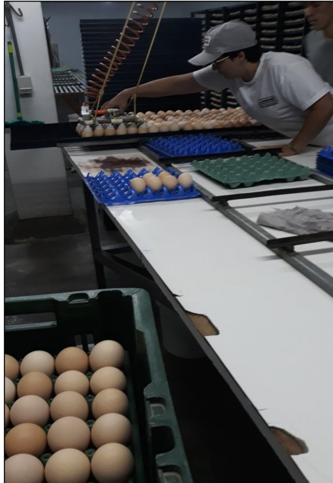
Figura 21 - Classificação dos ovos

ar. Os ovos já acomodados no carrinho de incubação eram marcados, informando o lote, data de incubação e a data prevista de transferência dos ovos ao nascedouro.