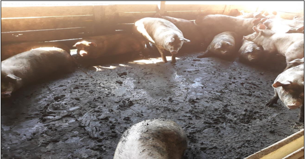
Figura 34 - Piso inteiriço de concreto