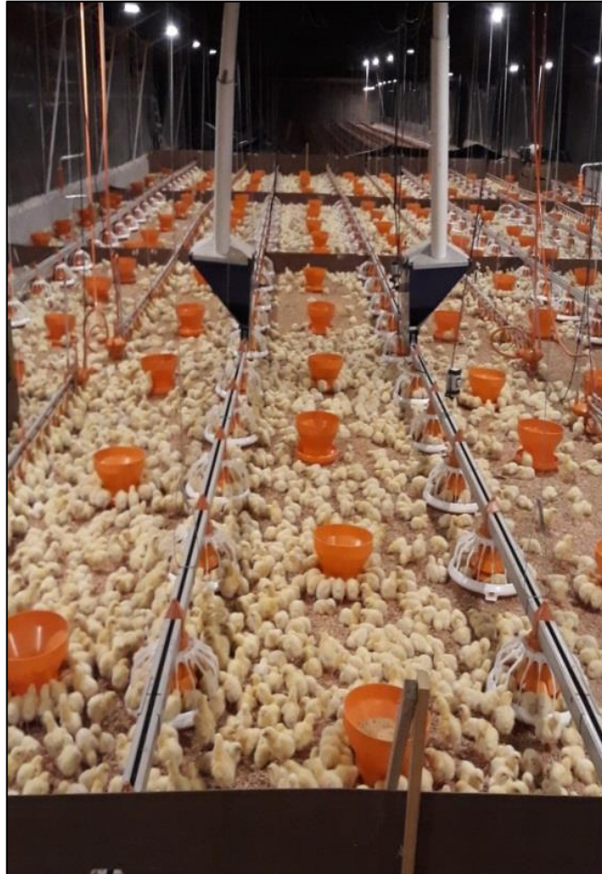
Figura 7 - Distribuição dos pintinhos

desta forma porque, conforme os pintinhos vão crescendo seu sistema termorregulador torna-se mais eficiente na manutenção da temperatura corporal (CORDEIRO et al., 2010).