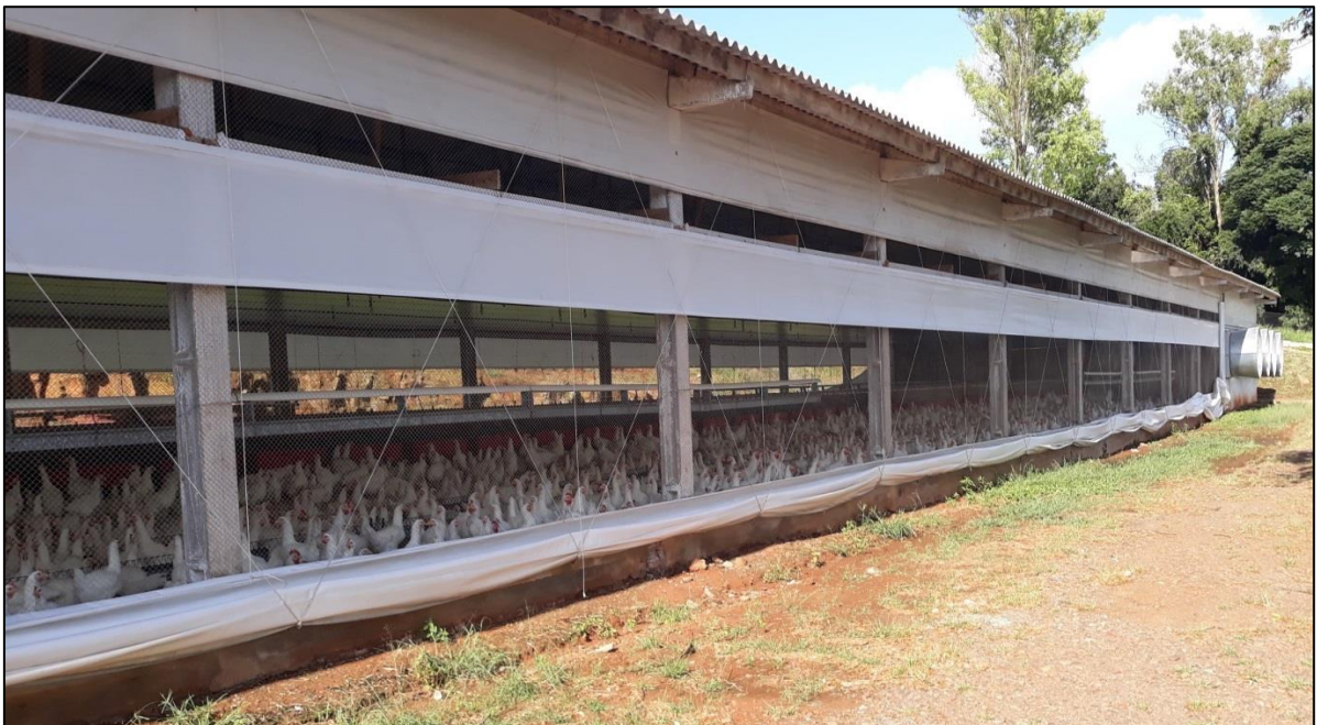
Figura 4 - Galpão de matrizes de frangos de corte em produção em Westfália