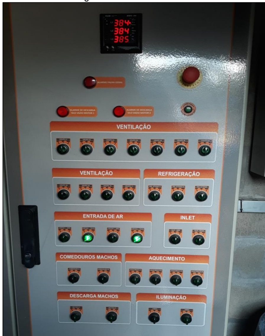
Figura 9 - Painel de controle

Para programar os parâmetros ambientais internos dos galpões em Sistema Dark House, que interferem no desenvolvimento das matrizes, foi utilizado um painel de controle automatizado (Figura 9), a partir de onde se controla os parâmetros de temperatura, ventilação e iluminação.