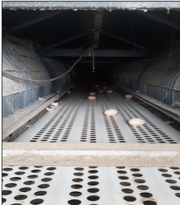
Figura 15 - Esteira de recolhimento de ovos do ninho automático