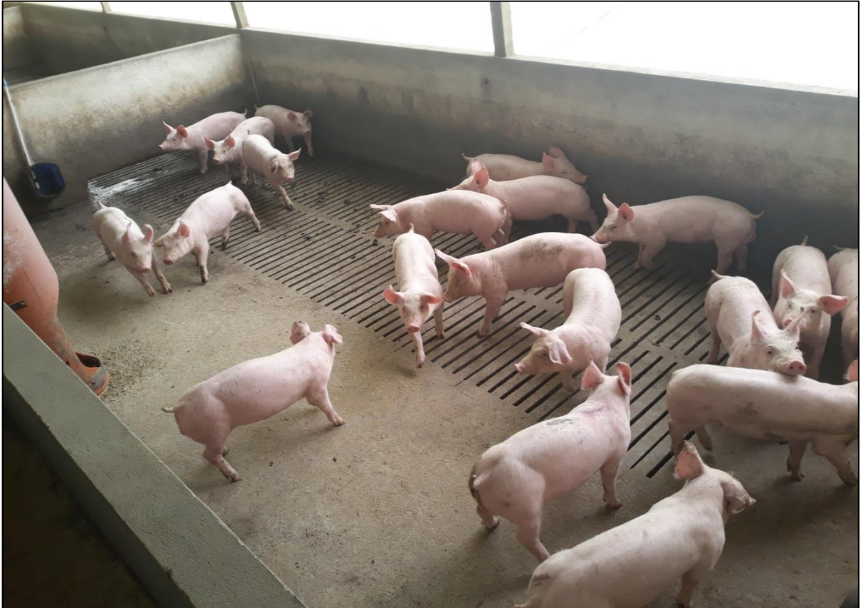
Figura 30 - Lote de leitões alojado há 1 dia

devia estar entre 16 e 27° C, uma vez que ainda jovens, os leitões necessitavam de temperatura mais alta, sendo importante o correto manejo de cortinas e ventilação (DIAS, SILVA, MANTECA, 2015).