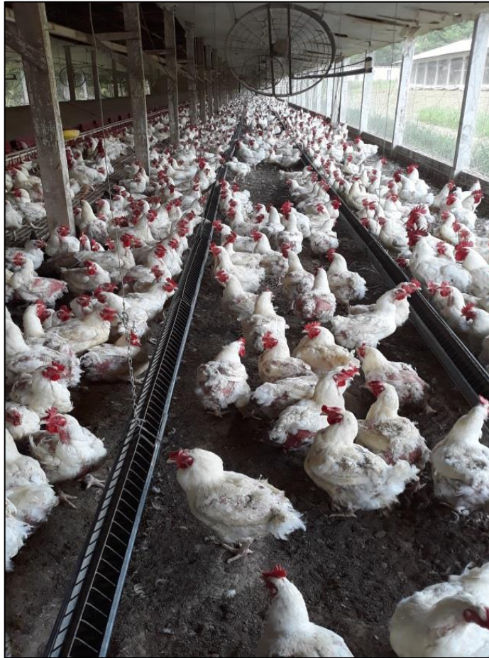
Figura 11 - Comedouro automático tipo calha com grade