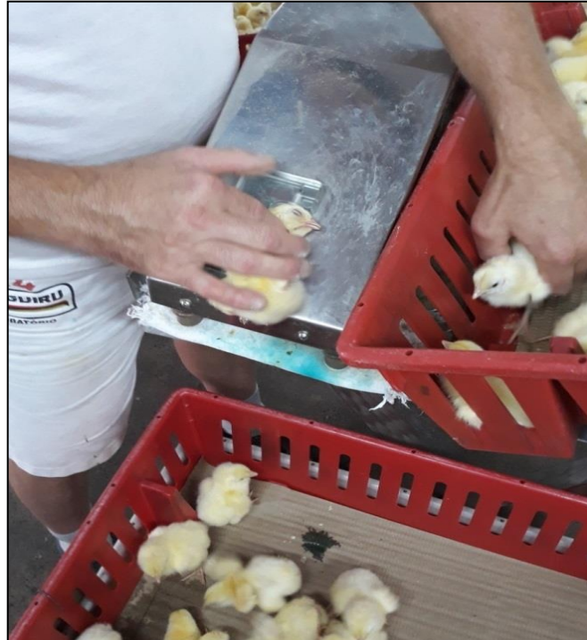
Figura 26 - Vacinação via subcutânea

Após a vacinação via subcutânea, os animais eram vacinados contra Bronquite Infecciosa, através de spray (Figura 27). Dessa forma, eles ficavam manchados devido o corante, sinalizando que foram vacinados.