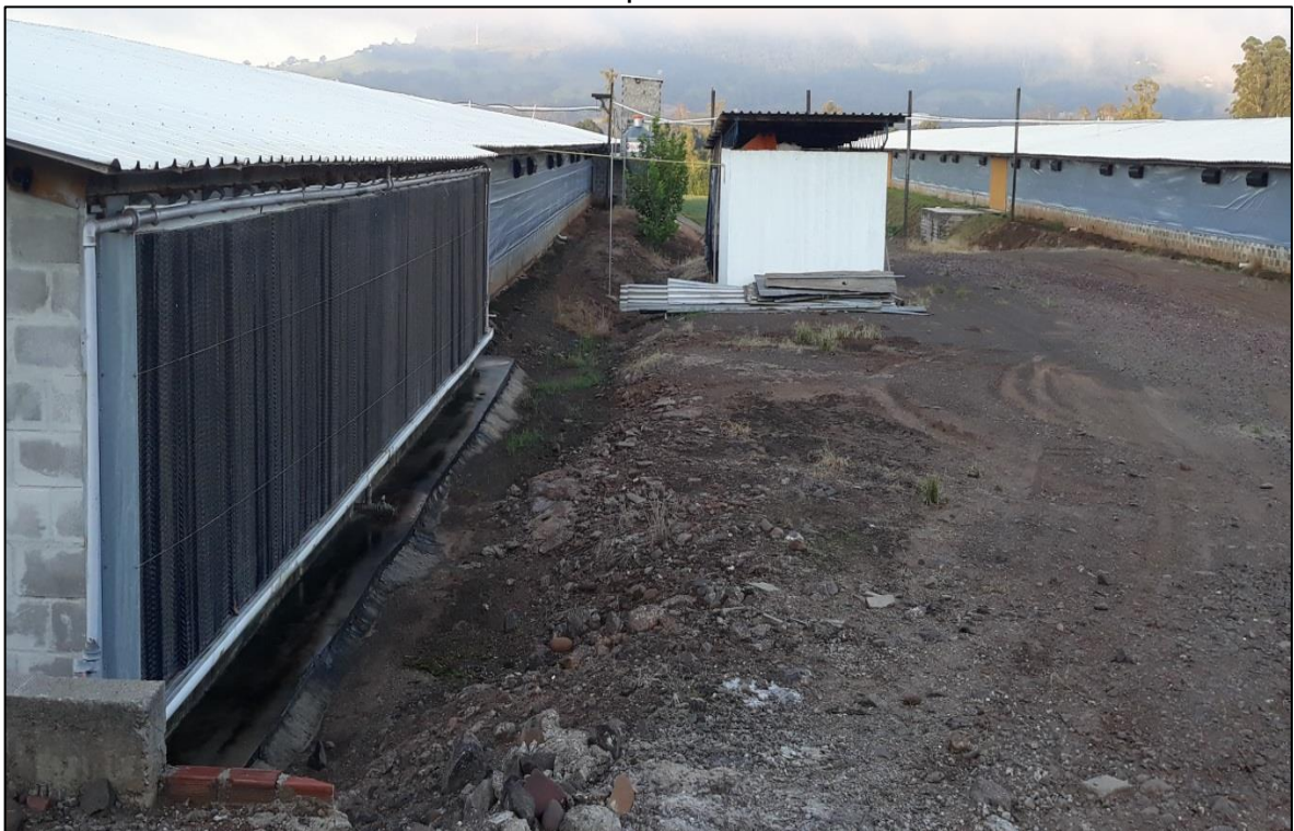
Figura 10 - Visão externa dos inlets nas laterais dos galpões e tunnel door à esquerda

Nas laterais, estão dispostos os inlets (Figura 10), que auxiliam no controle de umidade, ventilação e pressão interna do galpão.