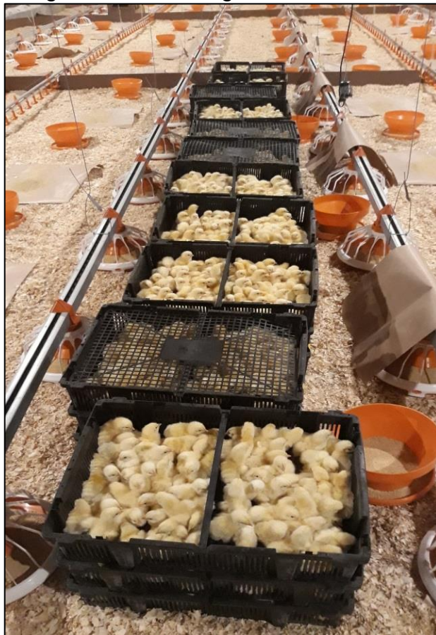
Figura 6 - Descarregamento das caixas

O manejo de alojamento se iniciou com o descarregamento das caixas contendo os pintos do caminhão para o aviário (Figura 6) e, posterior, distribuição dos mesmos pelo pinteiro. A instalação do pinteiro é feita na forma de uma divisão no galpão, que tem a função de manter os animais em grupos menores nos primeiros dias de vida para melhor manutenção de temperatura (Figura 7).