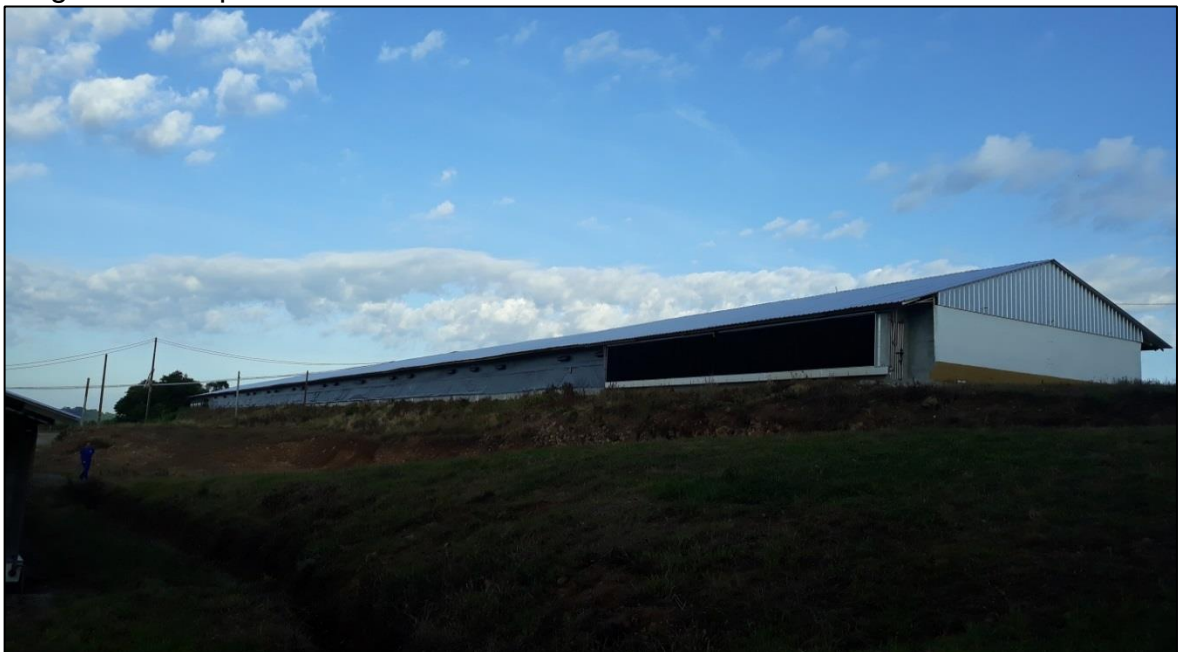
Figura 5 - Galpão de recria em Sistema Dark House localizado em Coronel Pilar

Todos os galpões utilizados na fase de recria das matrizes eram em Sistema Dark House (Figura 5), este tipo de galpão conta com isolamento do meio exterior por cortinas impermeáveis escuras e ambiente interno controlado por painéis de controle computadorizados, que regulam a temperatura, umidade, ventilação e iluminação, fornecimento de água e alimento e calefação. A criação nesse sistema se torna mais lucrativa, uma vez que as aves têm melhores índices zootécnicos propiciados pela manutenção do bem-estar através do monitoramento e regulação dos fatores ideais de ambiência (OLIVEIRA et al., 2014).