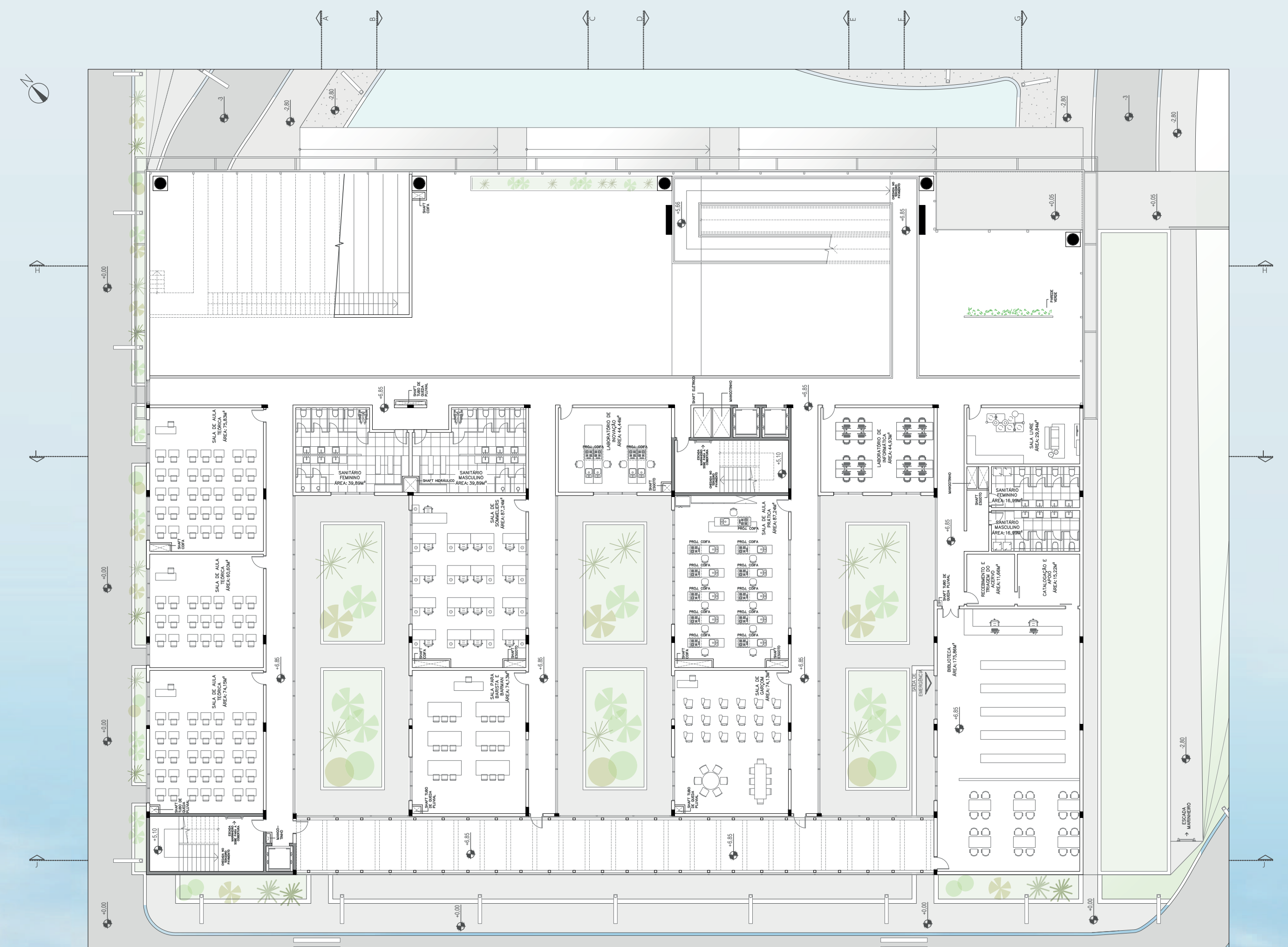
PLANTA BAIXA TERREO | ESCOLA SEM ESCALA