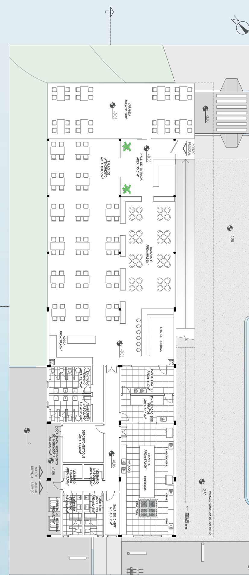
PLANTA BAIXA TERREO | RESTAURANTE SEM ESCALA